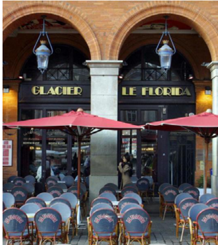
Café Le Florida, 12 Place du Capitole

8 février, 8 mars, 12 avril, 14 juin, 12 juillet, 13 septembre, 11 octobre et 13 décembre 2018